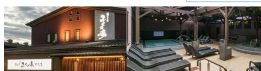
⑪ ふくの湯(早良店) イメージ