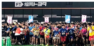
⑤ 最前列スタートイメージ