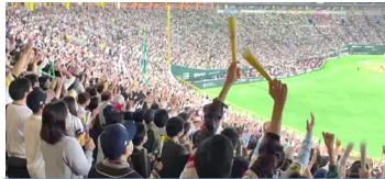
③ ホークス戦観戦イメージ