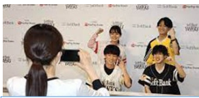
⑨ 記者会見場イメージ