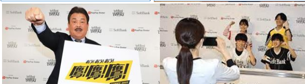
⑩プレスカンファレンスルームイメージ