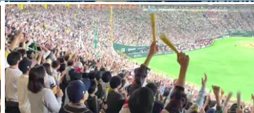
③ホークス戦観戦イメージ