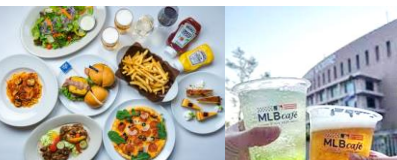
② MLBカフェでの宴会イメージ