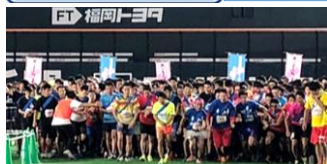
⑤最前列スタートイメージ