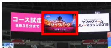
③ホークス戦観戦イメージ