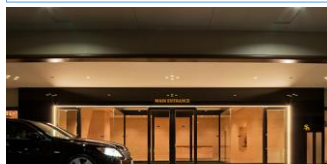
⑧メインエントランスイメージ